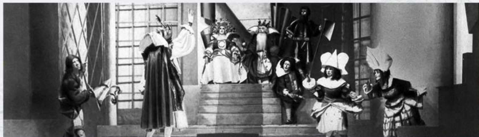
Спектакль «Жемчужина Адальмины» в Детском музыкальном театре Наталии Сац