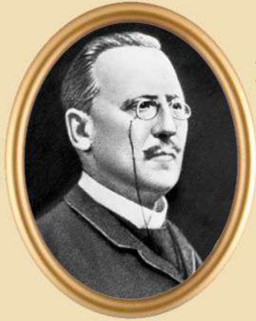
Петр Иванович Капнист - писатель и драматург