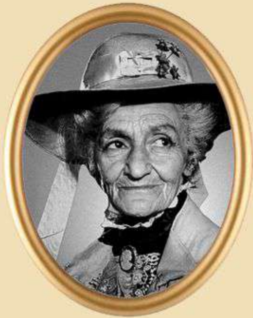
Мария Ростиславовна Капнист - советская и украинская актриса

У Василия Капниста было две дочери и четверо сыновей. Его внук Петр Капнист стал литератором. Правнучка Мария Капнист - известной актрисой.