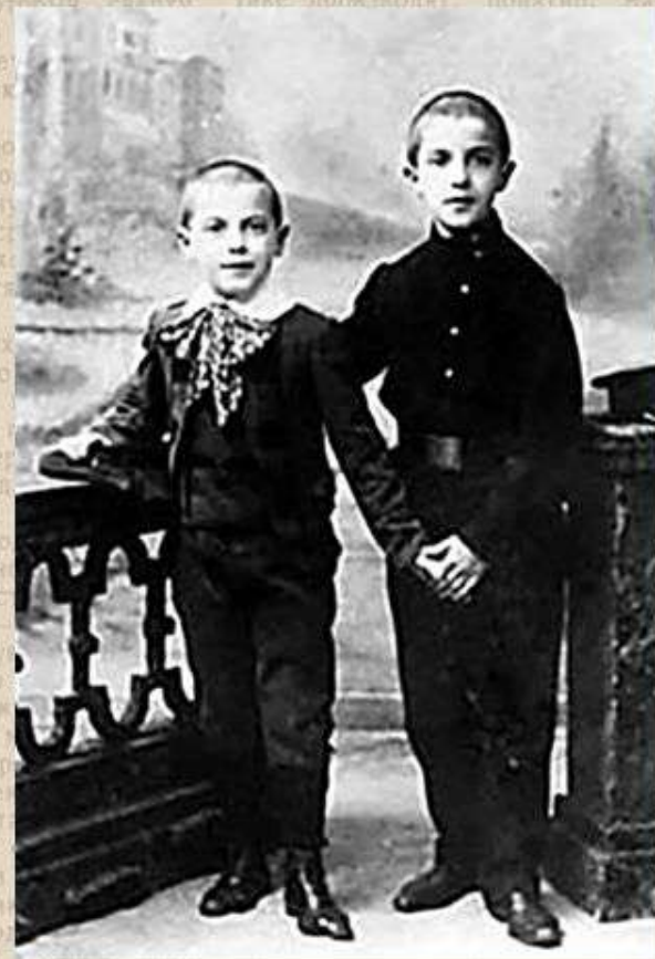
Братья Борис Ефимов (слева) и Михаил Кольцов. 1908

Журналистом Михаил, тогда еще Моисей, был с детских лет. Вместе с братом Борисом они трудились сначала над созданием своего домашнего журнала, а затем издавали рукописный журнал в школе. Младший брат отвечал за иллюстрации, а Миша писал статьи и сам же их редактировал.