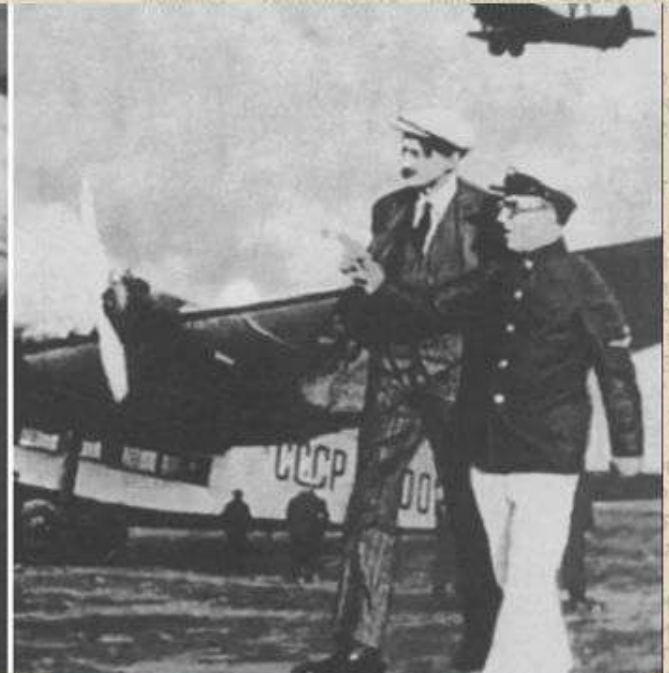
«Правильные» зарубежные писатели под присмотром: с Бернардом Шоу и Анри Барбюсом