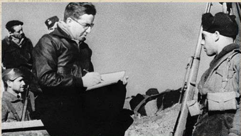
Михаил Кольцов с испанскими республиканцами

В кипящей лаве сопротивления мятежникам Кольцов участвовал как умелый политик и организатор. Тогда он делал заметки в своей записной книжке и готовил репортажи о событиях в стране. Именно они и легли в основу книги, вышедшей в 1938 году под названием “Испанский дневник” .