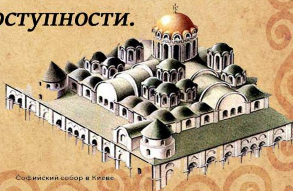
Софийский собор в Киеве

Князь Ярослав не просто читал книги или покупал их (кстати, в огромных количествах), но и создал библиотеку русских и греческих книг, которую передал Софийскому собору – для общей доступности.