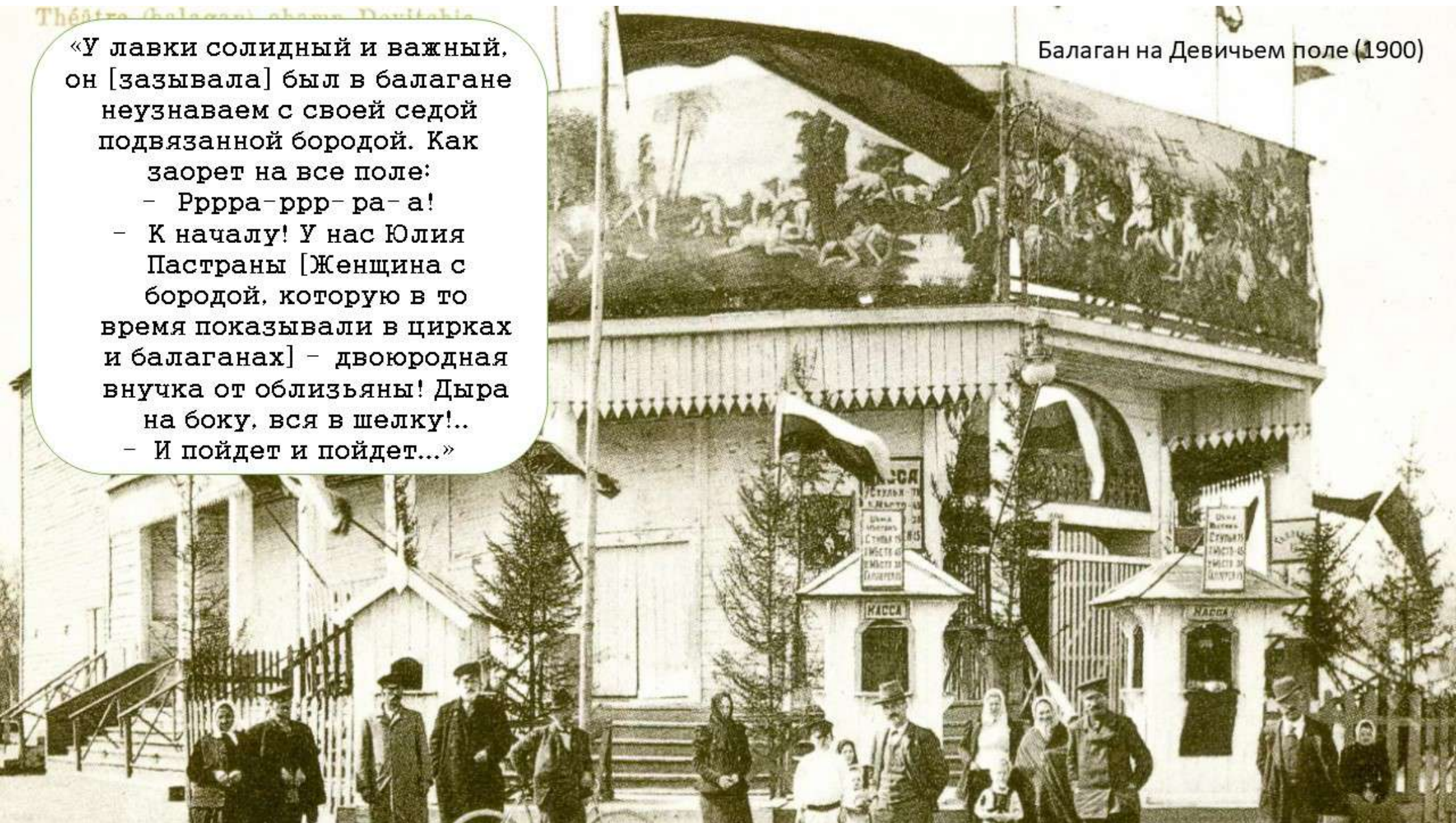
Балаган на Девичьем поле (1900)

«У лавки солидный и важный, он [зазывала] был в балагане неузнаваем с своей седой подвязанной бородой. Как заорет на все поле: - Рррра-ррр-ра-а! - К началу! У нас Юлия Пастраны [Женщина с бородой, которую в то время показывали в цирках и балаганах] - двоюродная внучка от облизьяны! Дыра на боку, вся в шелку!.. - И пойдет и пойдет...»