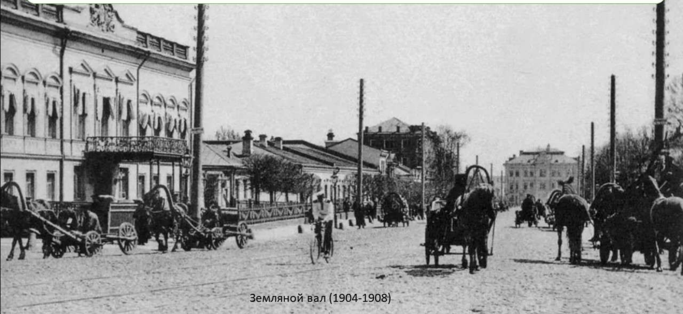
Земляной вал (1904-1908)

«У Земляного вала - вдруг суматоха. По всем улицам извозчики, кучера, ломовики нахлестывают лошадей и жмутся к самым тротуарам. Мой возница остановился на углу Садовой».