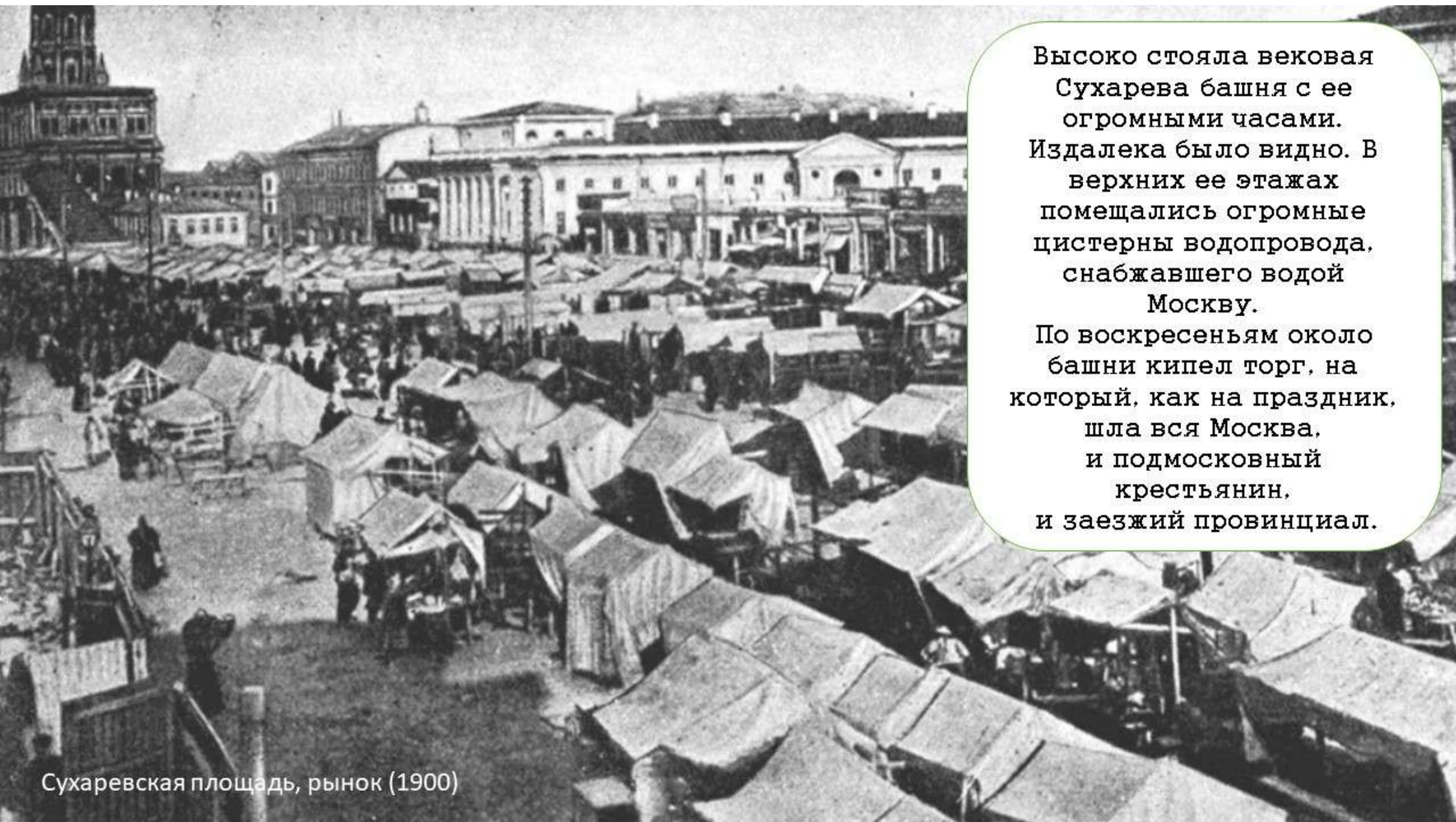
Сухаревская площадь, рынок (1900)

Высоко стояла вековая Сухарева башня с ее огромными часами. Издалека было видно. В верхних ее этажах помещались огромные цистерны водопровода, снабжавшего водой Москву.