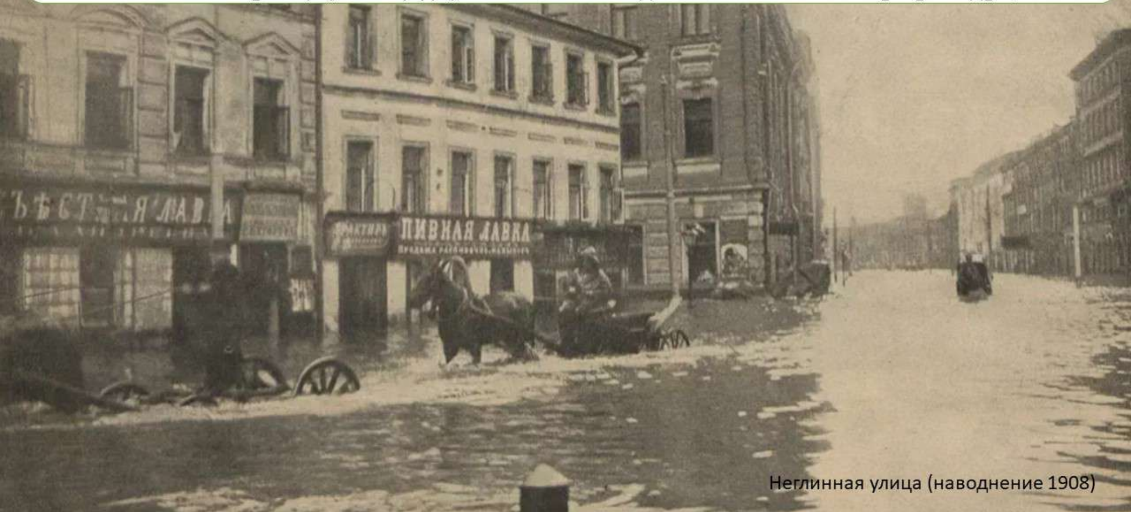
Неглинная улица (наводнение 1908)

«Светловодная речка Неглинка, заключенная в трубу, из-за плохой канализации стала клоакой нечистот, которые стекали в Москву-реку и заражали воду. С годами труба засорилась, ее никогда не чистили, и после каждого большого ливня вода заливала улицы, площади, нижние этажи домов по Неглинному проезду».