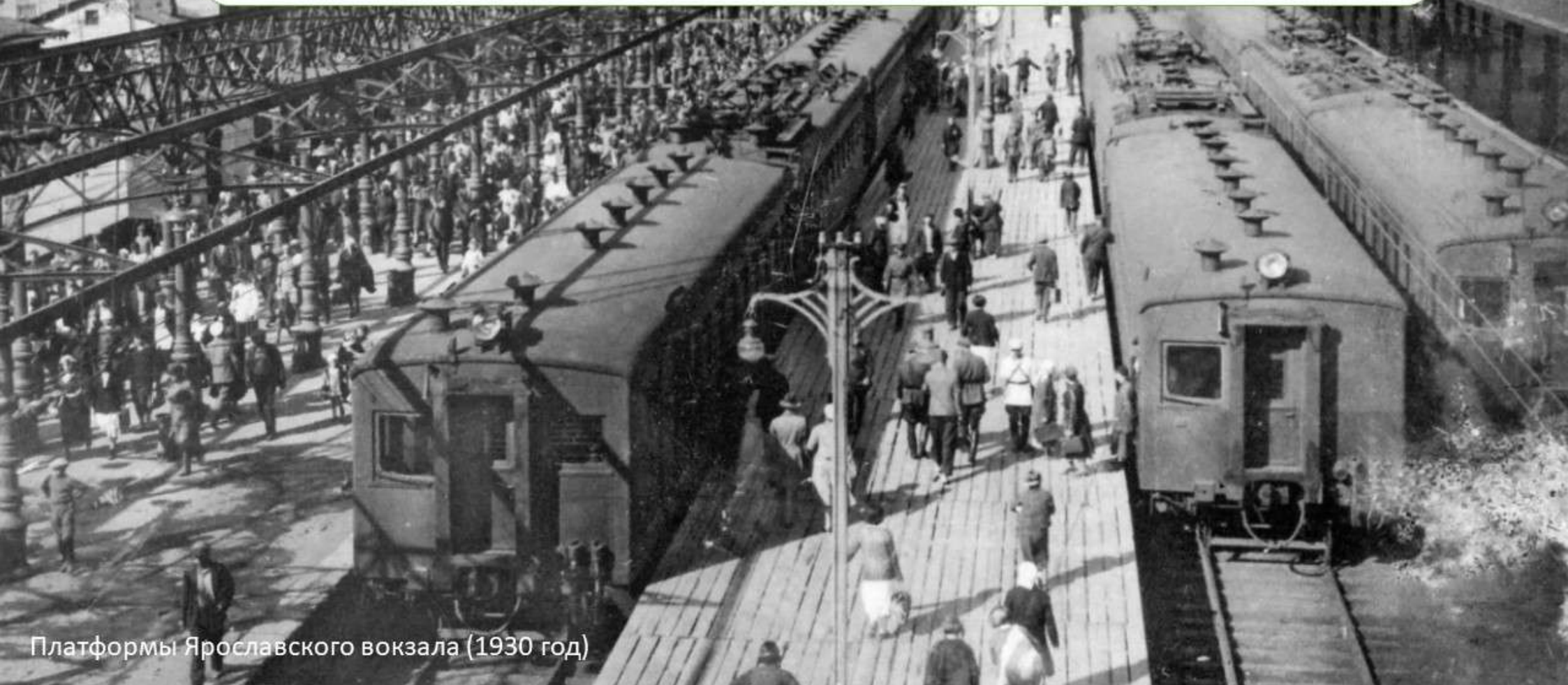
Платформы Ярославского вокзала (1930 год)

«Наш полупустой поезд остановился на темной наружной платформе Ярославского вокзала, и мы вышли на площадь, миновав галдевших извозчиков, штурмовавших богатых пассажиров и не удостоивших нас своим вниманием».