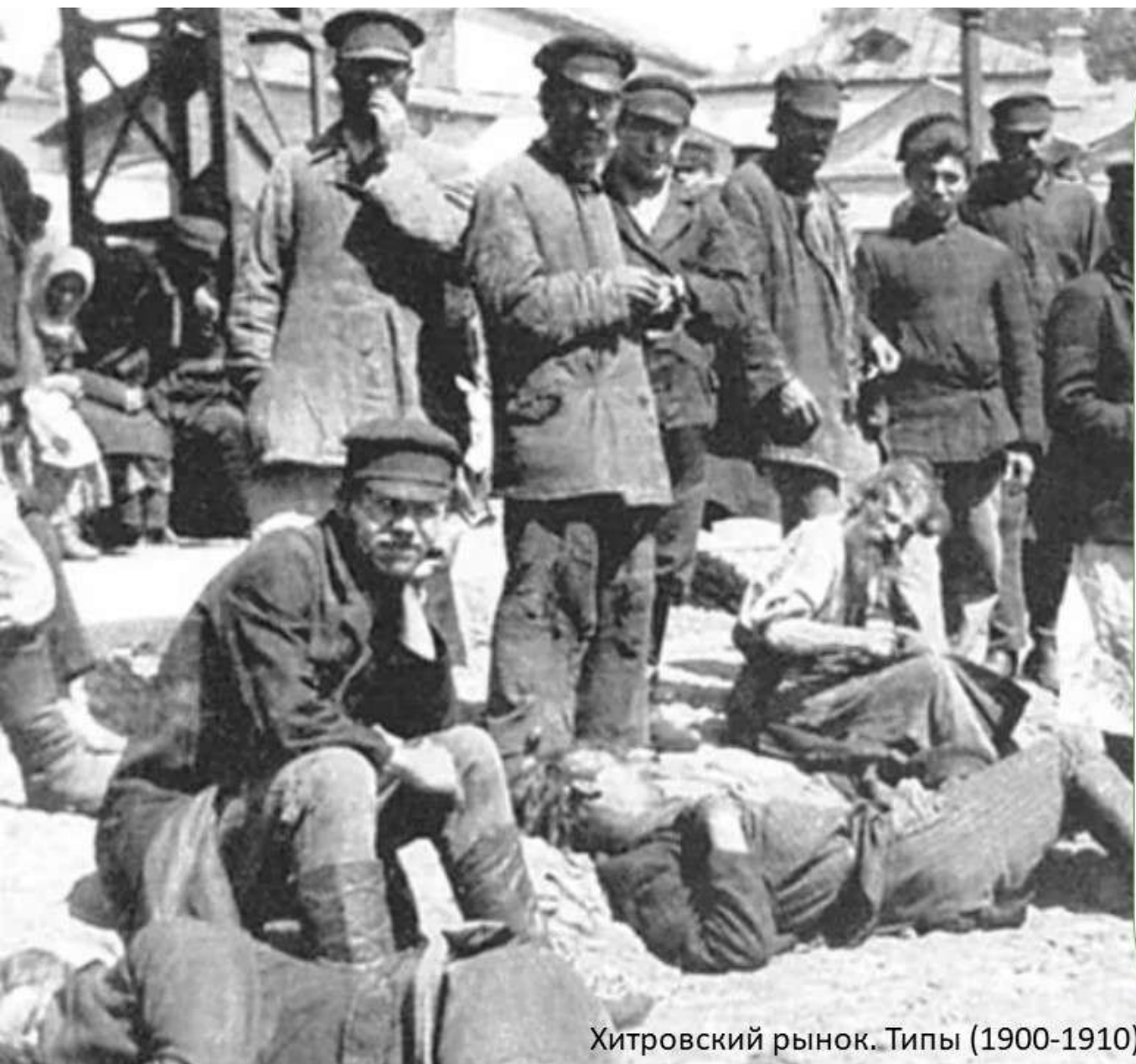
Хитровский рынок. Типы (1900-1910)