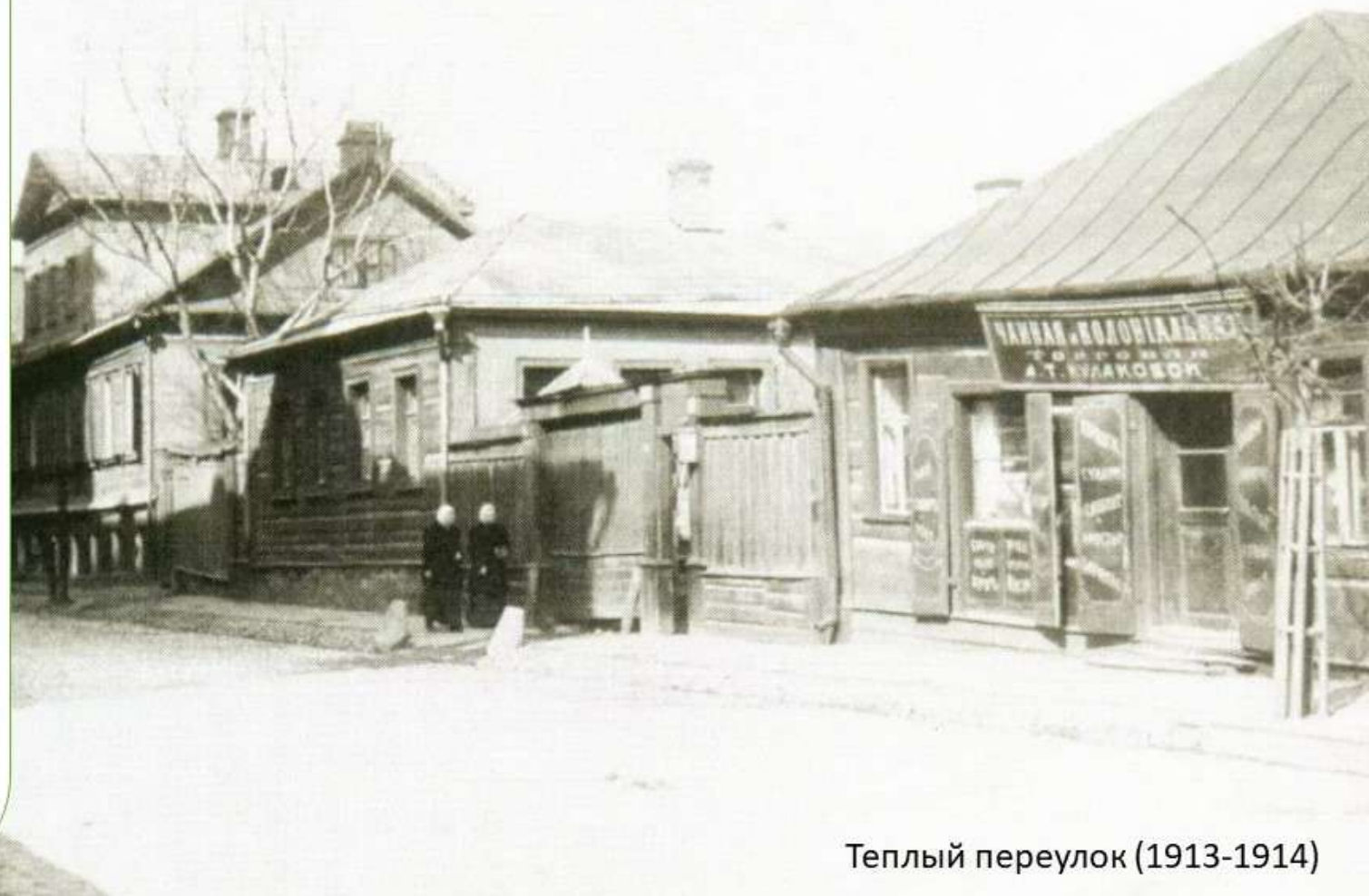
Теплый переулок (1913-1914)