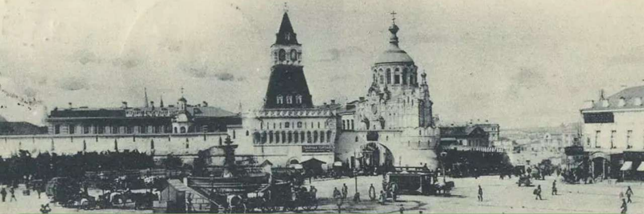
Лубянская площадь в центре фонтан (1895-1899)

«Из трактира выбегали извозчики - в расстегнутых синих халатах, с ведром в руке - к фонтану, платили копейку сторожу, черпали грязными ведрами воду и поили лошадей. Набрасывались на прохожих с предложением услуг, каждый хваля свою лошадь, величая каждого, судя по одежде, - кого "ваше степенство", кого "ваше здоровье", кого "ваше благородие", а кого "вась-сиясь!"»